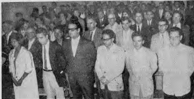
Vista de la concurrencia. Obsérvese en primer plano a Directivos de la Rerum Novarum, representantes de las Juntas Progresistas Democráticas y delegados del Movimiento Nacionalista de Alajuela.