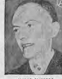
LLERAS CAMARGO ... el ex-Presidente de Colombia...