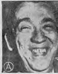
KUBITSCHKEK ...también ex-Presidente de Brasil

CARACAS, 20 (AP).— Entró hoy en el séptimo día el juicio que se sigue contra 114 individuos acusados de ser guerrilleros izquierdistas. El Coronel José Daniel Vará Custodio, Presidente del Consejo de Guerra que los juzga, dijo se efectúa casi interrumpidamente, con breves recesos para comer y descansar solamente. Los Estados Unidos han hecho responsable a Rusia por la presencia de esos bombarderos en Cuba, por lo tanto, dicen los funcionarios, los Estados Unidos esperan que los rusos indiquen pronto que los bombarderos son llevados de vuelta. MOSCU DA LA NOTICIA MOSCU, 20 (AP).— La Radio Moscú anunció esta noche el primer ministro Fidel Castro ofreció devolver los bombarderos hechos en Rusia. La noticia incluyó la declaración de Castro que eran antiguos y lentos. No hubo comentarios inmediatos del Soviet.