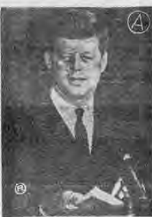
KENNEDY en la Conferencia de prensa de ayer...

URGENTE WASHINGTON, 20, (AP).— El Presidente Kennedy dijo esta noche que había sido informado hoy por el Primer Ministro soviético Khrushchev que los dos bombarderos soviéticos IL-28 serán retirados de Cuba dentro de 30 días.