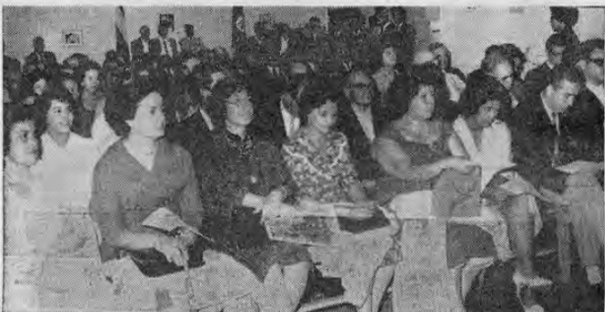
Otro aspecto de la concurrencia a la firma de la UNION DEMOCRATICA NACIONAL. Puede apreciarse gran cantidad de damas de las Juntas Progresistas como de agrupaciones invitadas especialmente.